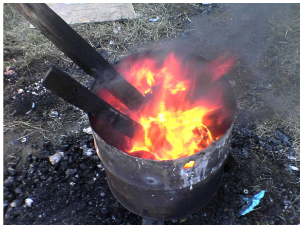
野外焼却行為の事例

県や市町村の監視指導や警察の取締りなどにより、大規模な産業廃棄物の不法投棄や野外焼却行為などの不適正処理は大幅に減少しました。