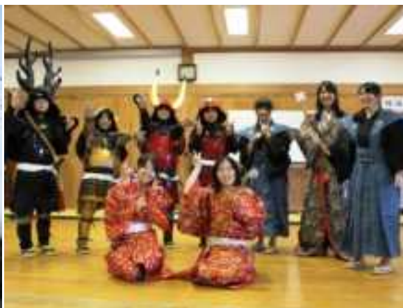
体験「甲冑試着」の様子