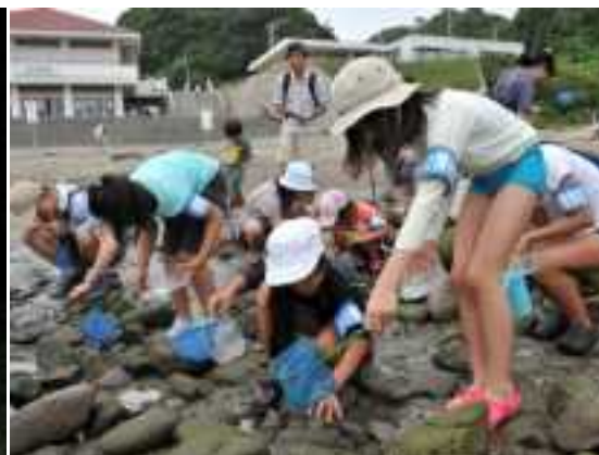
海辺での体験の様子