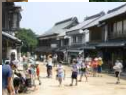
商家の町並みの様子