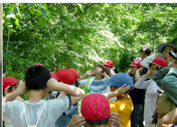
生態園における体験の様子