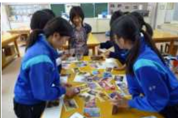
学校への出前授業の様子