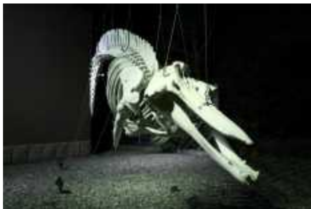
ツチクジラ骨格標本