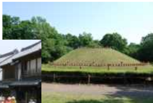
龍角寺古墳群 101号墳