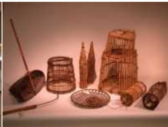
利根川下流域の漁撈用具 (県指定有形民俗文化財)

大多喜城分館（夷隅郡大多喜町） 昭和 50 年設置 平成 18 年分館化 平成 26 年度入館者 104,134 人