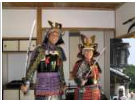
外国人の体験の様子