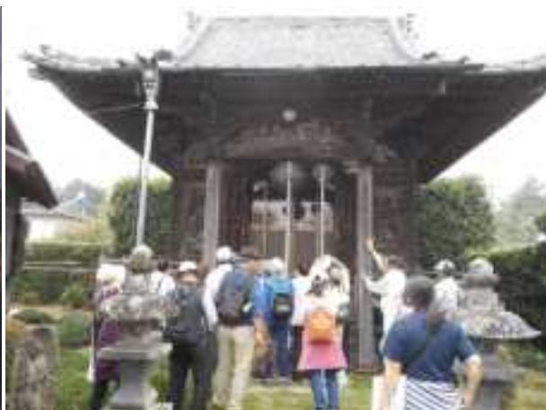
歴史講座「城下を歩こう」

美術館（千葉市中央区中央港） 昭和49年設置 平成26年改修 平成26年度入館者 30,036人 (平成27年1月再開館)