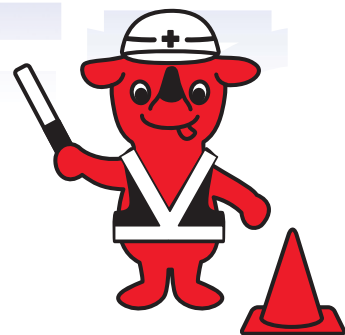
千葉県マスコットキャラクター「チーパくん」

日時：平成30年 8月28日 （火）・ 29日 （水） 午前10：00～午後4：30