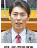
鴨川市・南房総市・安房郡