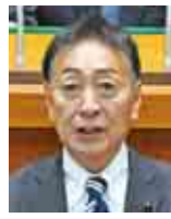
印西市・印旛郡栄町