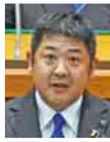
銚子市・香取郡東庄町