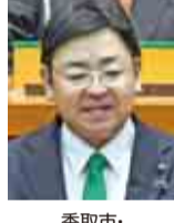
香取市・香取郡神崎町・香取郡多古町