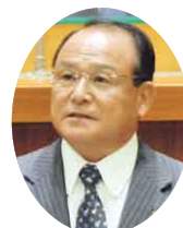
自民党 今井 勝 議員 (我孫子市)