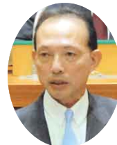
自民党 宇野 裕 議員 (匝瑳市)