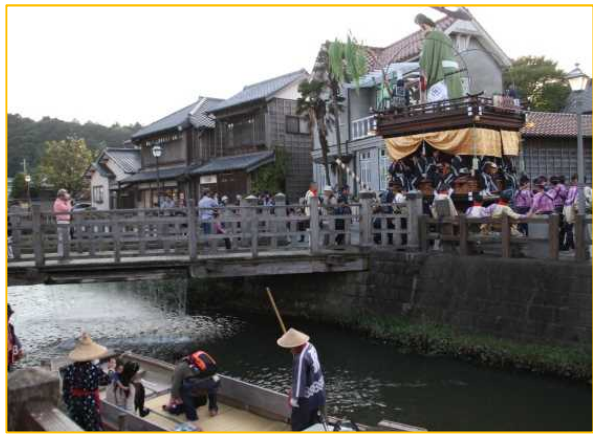
写真: 小野川沿い(さっぱ舟と秋祭り)