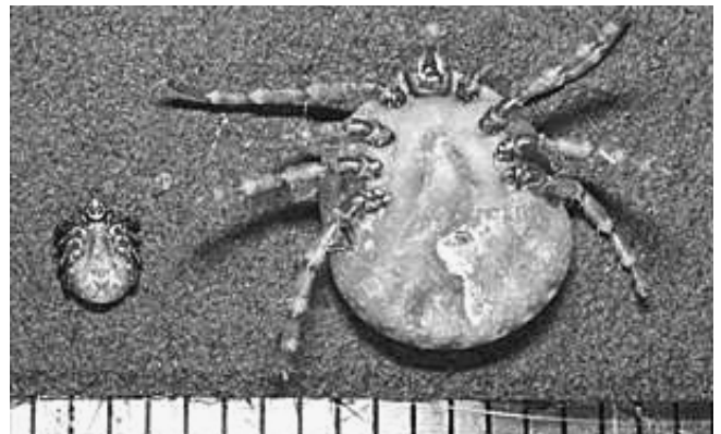
タカサゴキララマダニ(右)とオオトゲチマダニ(左) 1目盛りが1mm

アシダカグモ は脚を広げると大人の掌にも余る大きなクモですが、不用意につかまなければ咬むことはありません。1968年に初めて千葉市の住民から相談がありましたが、当時の分布域は東が神奈川県までといわれていました。ライフサイクルが長いクモで急速な分布域の拡大は難しいと思われませんが、98年に佐倉、2001年に佐原、02年に柏など県北地域で相次いで見つかりました。アシダカグモは千葉県が生息北限といわれるクモですが、北限は既に茨城県に移ったと考えてよいでしょう。 タカサゴキララマダニ は西日本のマダニ被害の主要な原因種であり、東京都以西の温暖な地域が生息地とされています。2000年頃、房総丘陵の野生シカ調査者に被害が発生し千葉県での生息が確認されましたが、県内への侵入は狩猟獣の人為的な放逐が疑われています。体長が7mmをこえる大きなダニで、千葉県産では最大とされてきたオオトゲチマダニと比較するとその巨大さがわかります（写真）。 クリイロコイタマダニ は亜熱帯地域に普通のダニで、日本では沖縄県に多く見られます。飼育犬の移動により分布が拡大するといわれ、東京、大阪などの都市部で散見されていますが、千葉県では2007年に千葉市内で飼育されていた犬に寄生が認められました。新たに見つかる一方で温暖化により姿を消すと思われる虫もいます。 アラトツツガムシ は北日本に多い寒冷地性のダニですが50年代には県内各地で採集されました。しかし1983年以降は全く採集がなく、生息地の乾燥化により姿を消したものと考えられます。