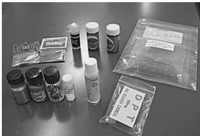
様々な違法ドラッグの製品

違法ドラッグは、規制を逃れるため目的を偽装（研究用試薬、芳香剤、アロマ、ビデオクリーナー、お香、観賞用植物標本等）して販売されています。形状は液体、粉末、固形、カプセル、植物の粉末、種など様々で、アダルトショップやインターネットなどにより手軽に入手することができる状況にあります。