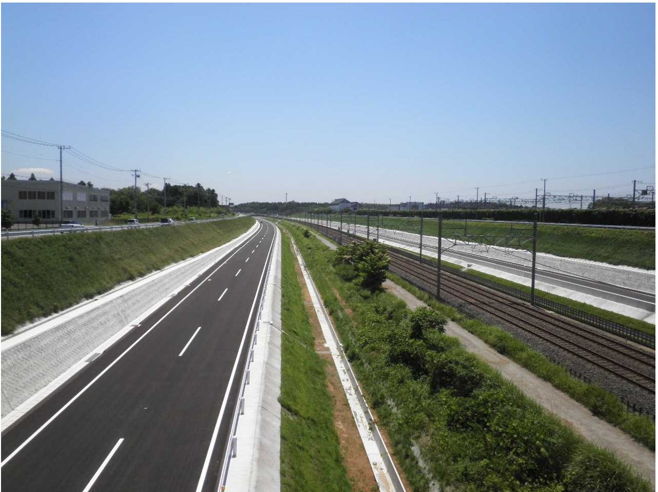
千葉臼井印西線との交差部付近から成田方面を望む