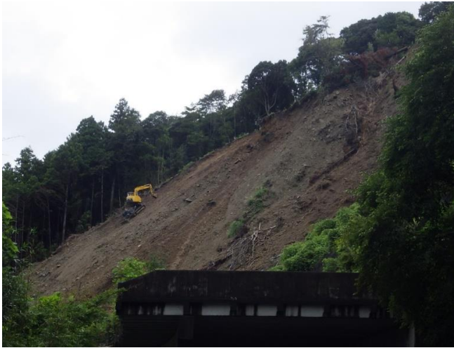
法面掘削機による不安定土塊の撤去（6月～8月）