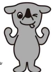
千葉県マスコット キャラクター チーパくん