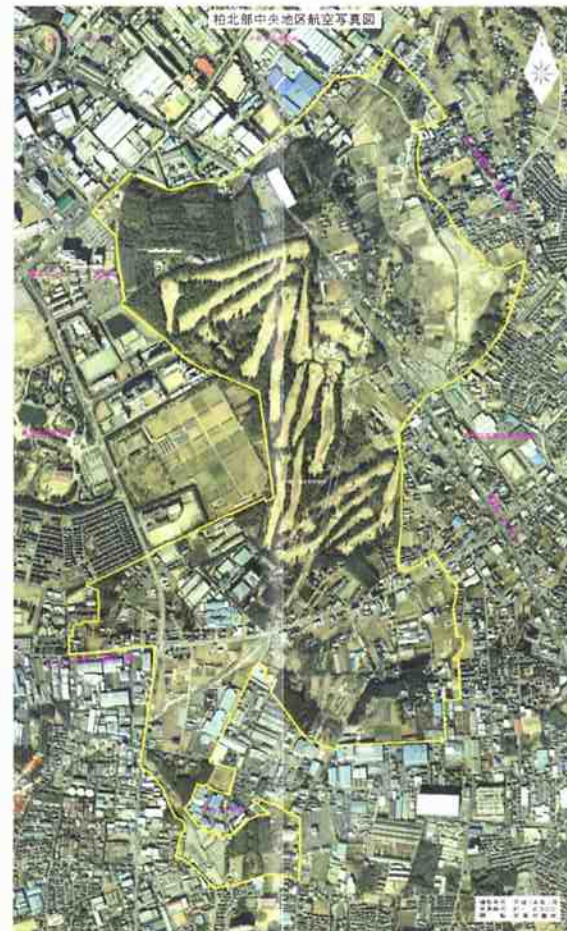
事業当初の航空写真です【H14.1撮影】

今後、上写真のような地盤調査や仮設道路(工事用の進入路)が各地区で設けられていきます。整備中は皆様には何かとご迷惑をおかけしますが、ご協力のほどよろしくお願いします。