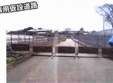
(写真は5号調整池付近のもので)