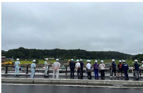
河道拡幅（旧北川橋撤去）工事（新北川橋）

参加者数：21名（中学生3名、教員3名、一宮川流域治水協議会長南町部会員12名、事務局3名）