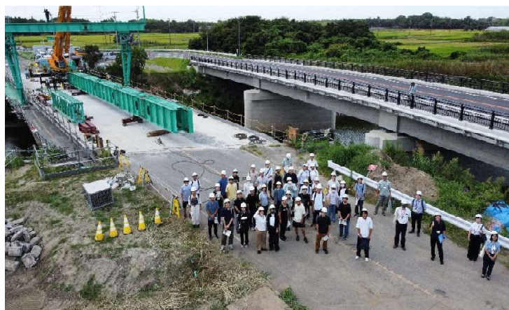
河道拡幅（旧北川橋撤去）工事現場

参加者数：39名（15～21歳：30名（男18名・女12名）、 31～50歳：5名（男2名・女3名）、付添：4名）