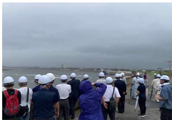
一宮川河口見学（一宮 PA）