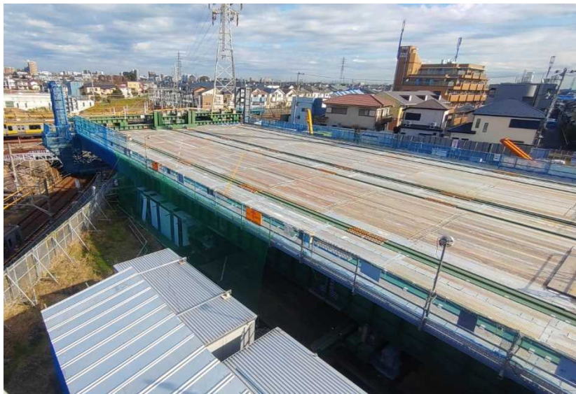
(鷺沼側) 作業台構築工 完成

この作業台で橋桁を組み立てます。 今年の夏頃に線路上に橋桁を架ける作業を実施する予定です。