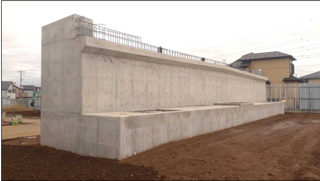
(鷺沼台側) 橋台築造工 完成