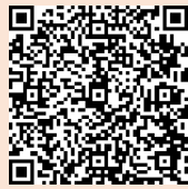
（ちば電子申請サービス）