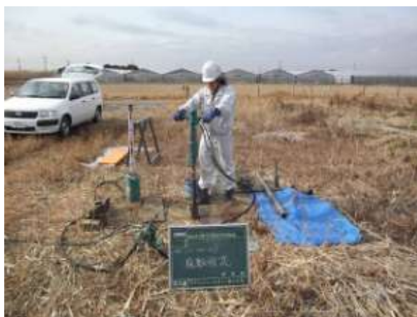
図 2-6 大網白里町の現場風景