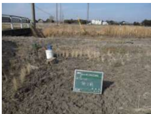
図 2-3 山武市の現場風景