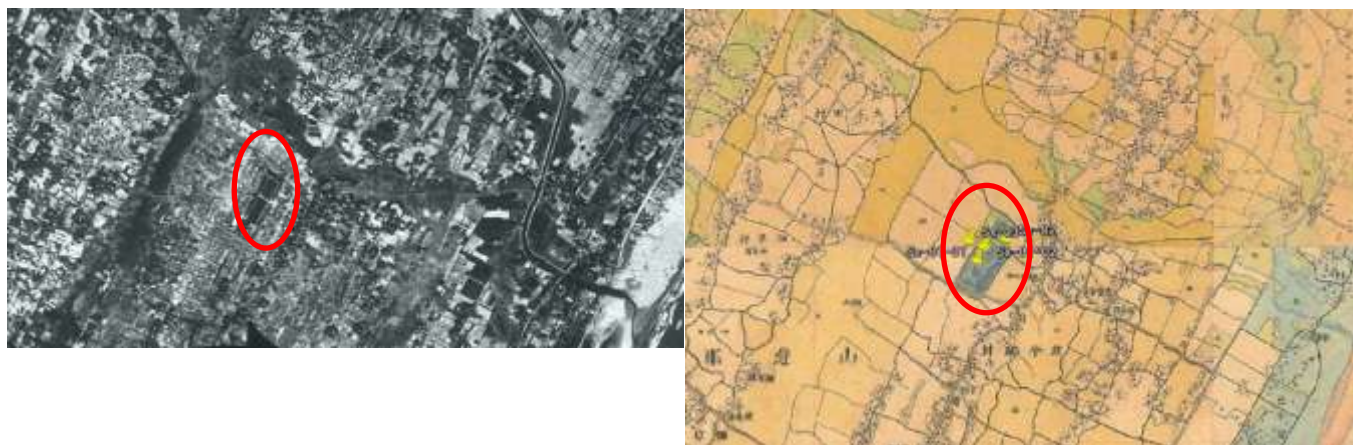
図 2-5 大網白里町の米軍写真（昭和 22~昭和 23 年撮影）および明治期の迅速図