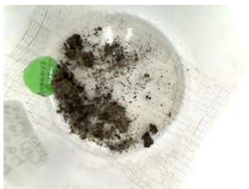
図 2-4 Sa-02 に含まれる種（年代測定に利用）