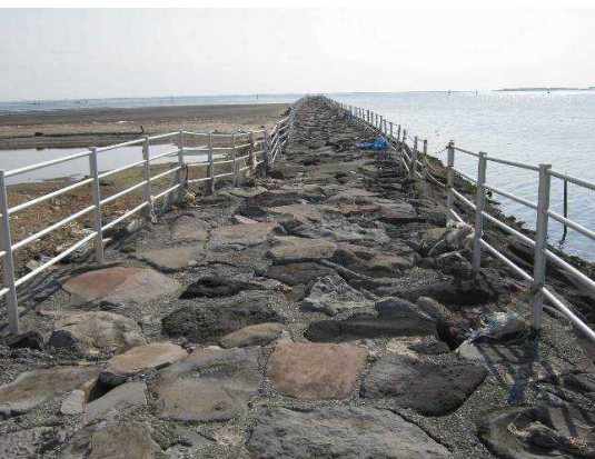
写真 2-1-34(101 ページ) 防波堤の被害 (ふなばし三番瀬海浜公園：)