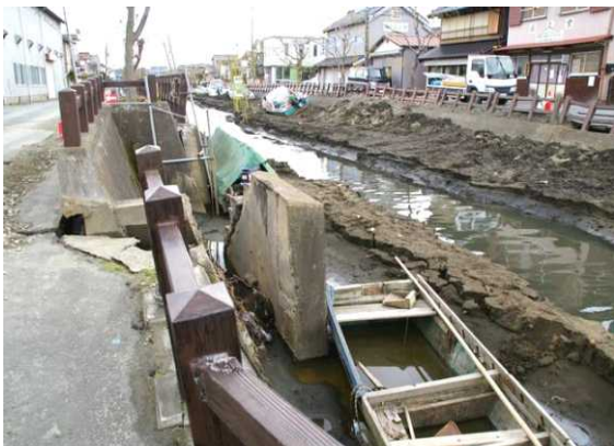
写真 3-4-15(179 ページ) 液状化と側方流動による噴砂と護岸倒壊