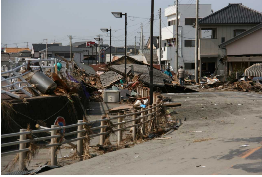
写真 2-2-23 (109 ページ) 津波による被害 (旭市飯岡地域：)