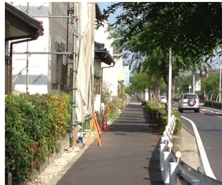
土砂は取り除かれ、歩道も整備された。