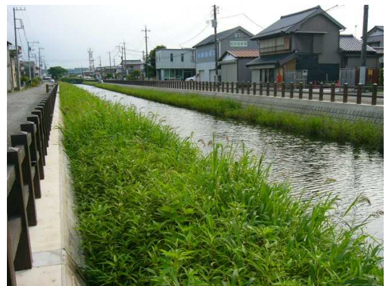
鋼矢板基礎の打設を行うなど、護岸改修工事により復旧した。