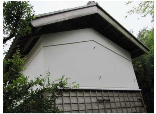
壁の漆喰を塗り直し、修復した。