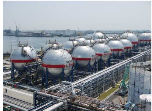
平成 25 年 7 月、同タンクは耐震性を高め再建された。