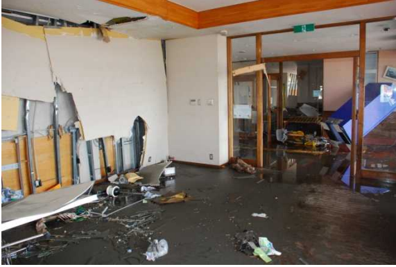
写真 2-2-22(109 ページ) 津波による被害 (銚子マリーナ・センターハウス：)