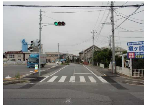
土砂、泥水は取り除かれ、電信柱や信号機も 修繕された。