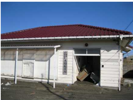
【旭警察署 矢指駐在所】

東日本大震災により津波被害を受けて閉所していたが、その間、勤務員は警察署を拠点に活動していた。