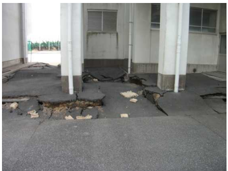
【県立浦安南高等学校】 填砂、噴水及び地盤沈下状況（上から、駐車場付近、 玄関前、渡り廊下付近）