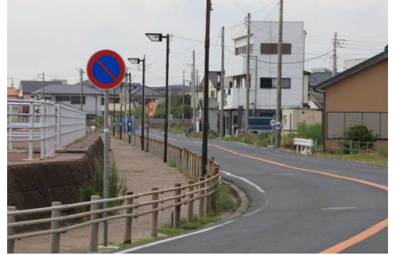
津波による倒壊家屋や、漂流物は撤去された。