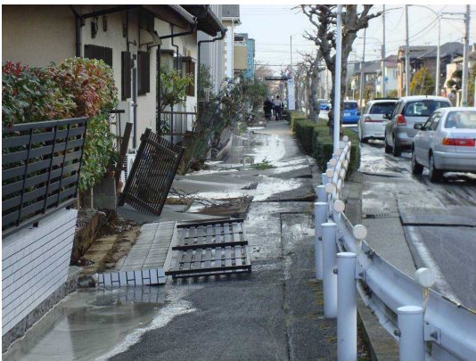
写真 1-3-8 (58 ページ) 道路の隆起、土砂の噴き出しが発生した。 (習志野市香澄：)