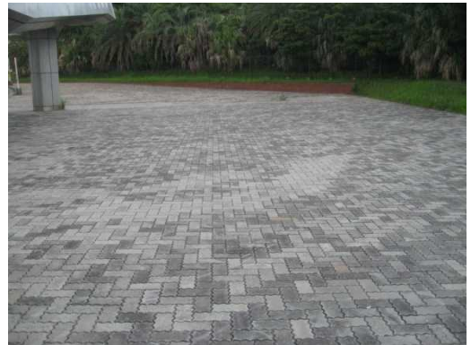
地盤を平坦な状態に戻すとともにタイルを再敷設した。