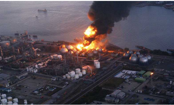
写真 2-1-15(79 ページ) LPG タンク爆発火災 (コスモ石油(株)千葉製油所：)