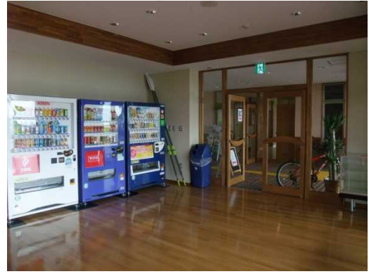
破壊部分は補修、床面は清掃し、平成 25 年 4 月から 運営を再開した。