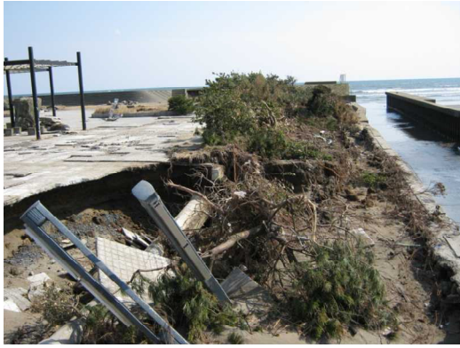
写真 2-2-15(106 ページ) 津波の進入口となった矢指川河口。松や支柱が上流側に倒れている。