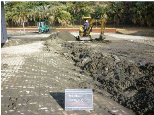
写真 3-12-13(232 ページ) 応急措置及び応急復旧状況 (千葉市・幕張海浜公園：県土整備部提供)