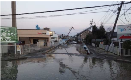
写真 1-3-3 (57 ページ) 泥水が噴出し電柱が傾いた。 (我孫子市布佐地区：)