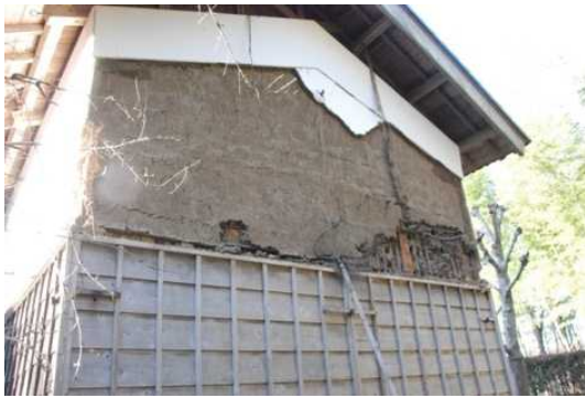
【体験博物館 房総のむら】 地震の影響により、土蔵の壁が崩落した。

体験博物館・千葉県立房総のむらでは、上総の農家の土蔵の壁が崩落するなどの被害があった。房総のむらは、安全確認のため、平成23年3月30日まで臨時休館した。