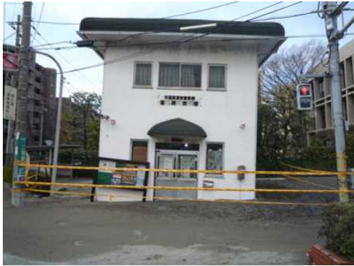
【浦安警察署 富岡交番】