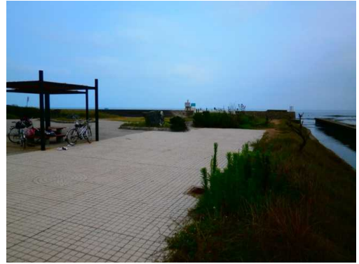
崩落箇所については修復され、通行可能となった。