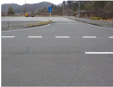
施設への出入口の状況