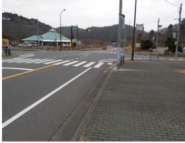
出入口①の状況 2車線分の道路幅がある