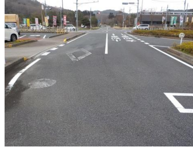
出入口②の状況 2車線分の道路幅がある