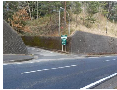
出入口④(昭和の森フォレストビレッジ)の状況