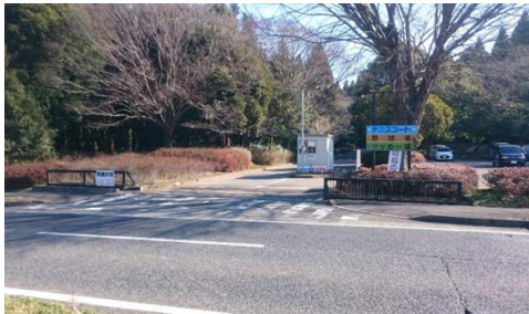
出入口③(第3駐車場) 2車線分の道路幅がある