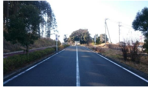
出入口②(第2駐車場)の状況 2車線分の道路幅がある