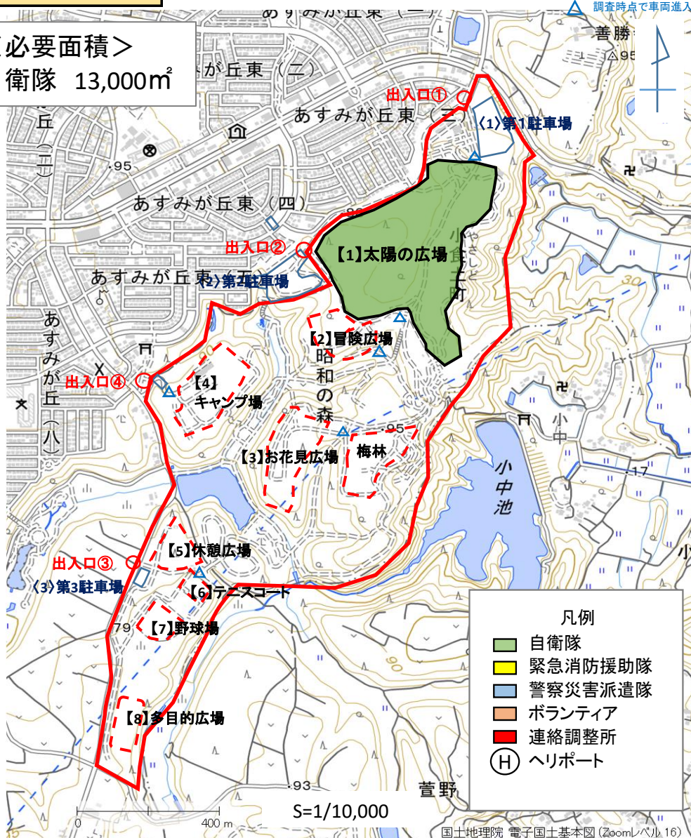
広域防災拠点内の場所及び施設の利用計画