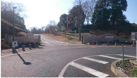
出入口①(第1駐車場)の状況 2車線分の道路幅がある