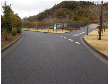
施設への出入口の状況