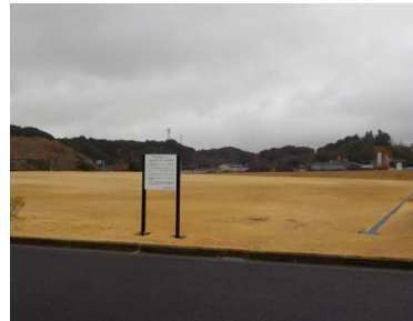
施設内広場等の状況