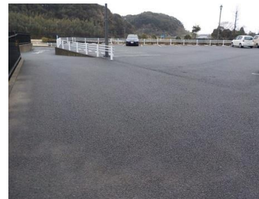
施設内広場等の状況