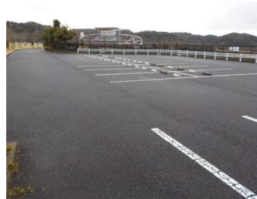
施設内広場等の状況