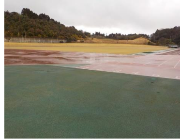
施設内広場等の状況