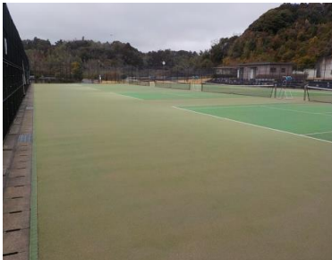
施設への出入口の状況