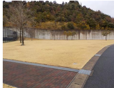
施設内広場等の状況