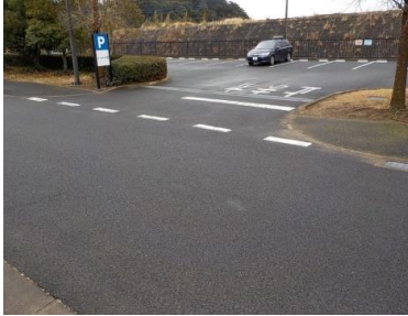
施設への出入口の状況