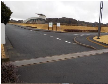
施設への出入口の状況