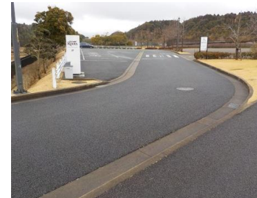
施設内広場等の状況