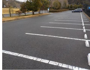
施設内広場等の状況