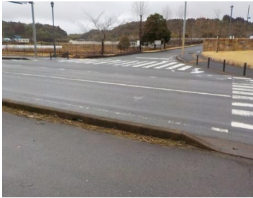
出入口①の状況 2車線分の道路幅がある