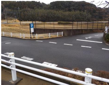
施設への出入口の状況