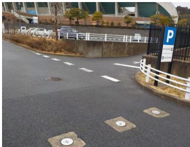
施設への出入口の状況