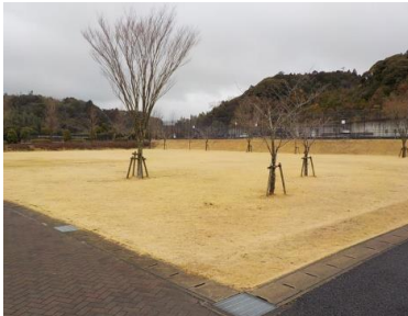
施設への出入口の状況