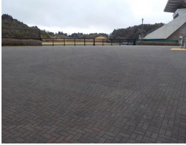
施設への出入口の状況