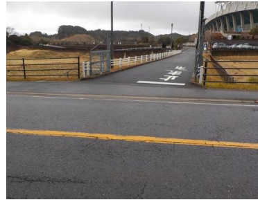
出入口②の状況 2車線分の道路幅がある