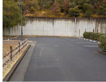
施設内広場等の状況