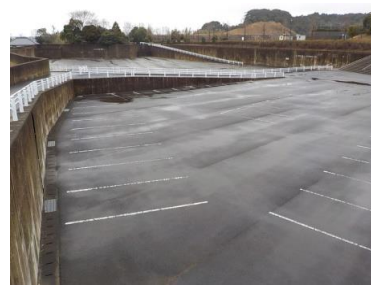
施設内広場等の状況