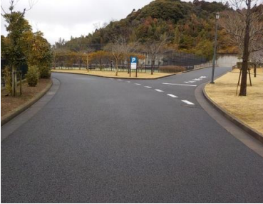
施設への出入口の状況