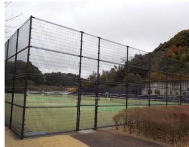
施設内広場等の状況