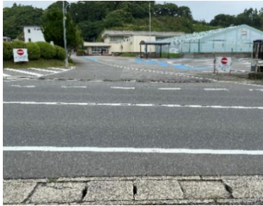
出入口①の状況 2車線分の道路幅がある