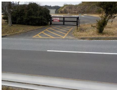
出入口③の状況 2車線分の道路幅がある ※陸上競技場への進入は不可