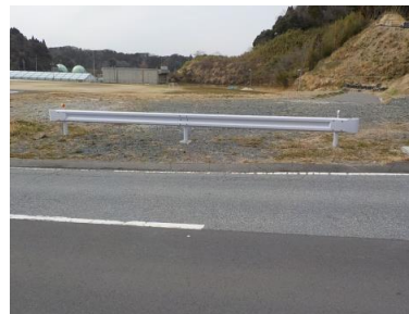
出入口④の状況 2車線分の道路幅がある ※陸上競技場への進入路 幅員 4m