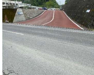
出入口②の状況 2車線分の道路幅がある