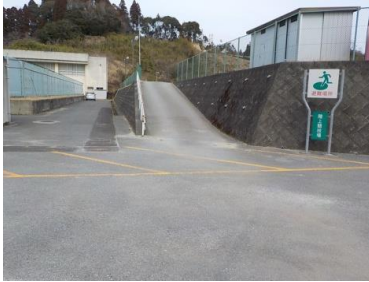
施設への出入口の状況 幅員は3m