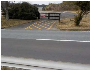
施設への出入口の状況 ※ヘリポート入口から陸上競技場へは進入