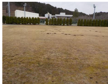
施設内広場等の状況