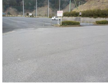
出入口②の状況 2車線分の道路幅がある