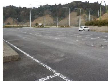
施設内広場等の状況