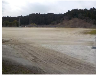
施設内広場等の状況