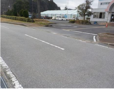
出入口①の状況 2車線分の道路幅がある