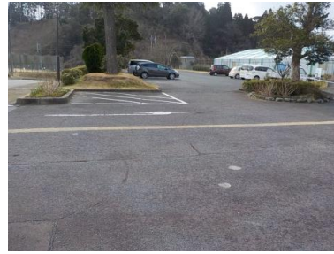
施設内広場等の状況