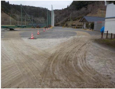
施設への出入口の状況