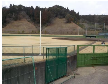
施設内広場等の状況