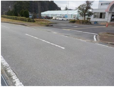
施設への出入口の状況