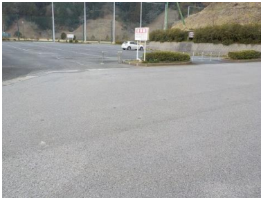
施設への出入口の状況