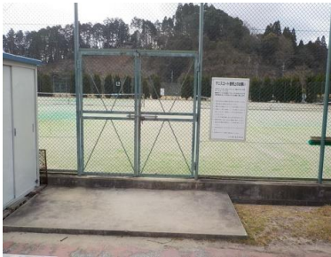
施設への出入口の状況