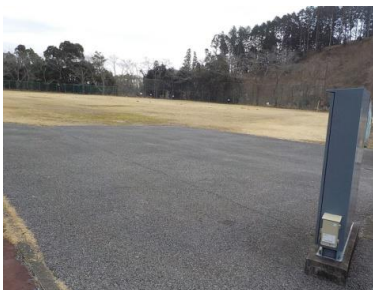
施設への出入口の状況