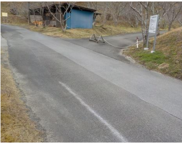
出入口③の状況 1車線分の道路幅がある