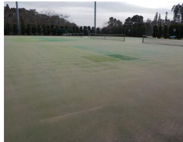
施設内広場等の状況