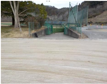
施設への出入口の状況