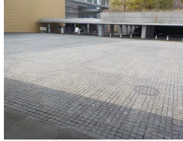
施設内広場等の状況 (地下駐車場入り口)