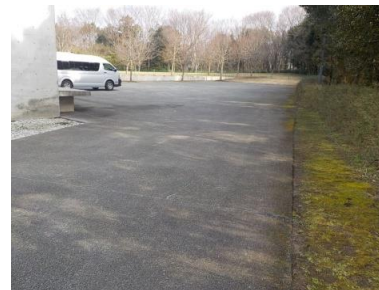
施設内広場等の状況 (駐車スペース)