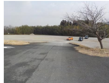
施設内広場等の状況 ※中央部の段差で二分割されている