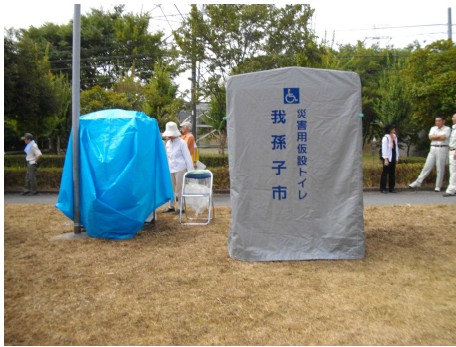
簡易トイレ（我孫子市）