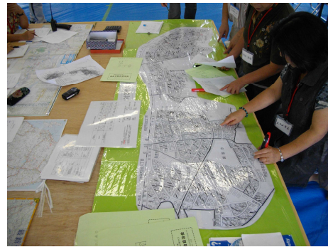
防災本部訓練の様子（支部との無線による情報通信）