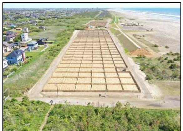
海岸県有保安林における砂丘造成と植栽工事

エ) 砂丘の造成による津波被害の軽減と、飛砂や潮害等から県民の生活を守るため、企業や市民活動団体等の協力を得て、病害虫に抵抗力のあるクロマツや広葉樹を植栽することなどにより、自然災害に強い海岸県有保安林の整備・再生を行います。【北林】