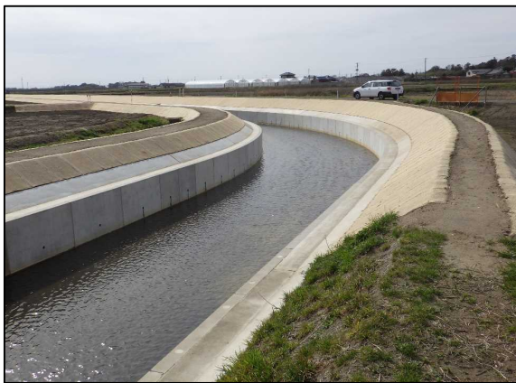
湛水防除事業で整備した排水路