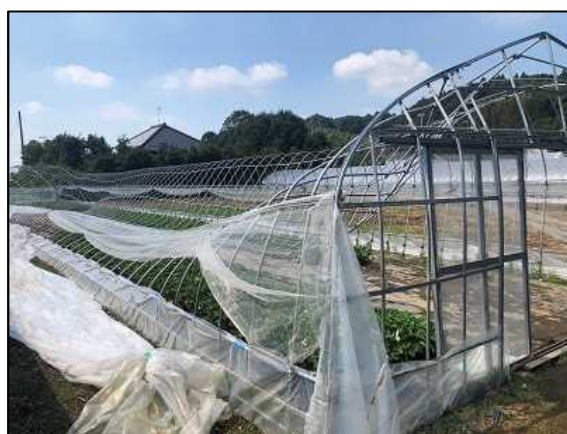
令和元年房総半島台風で被災した園芸用施設

また、海外から侵入した新規病虫害や家畜伝染病は産地に大きなダメージを与えています。