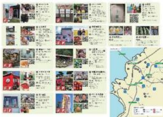
「きみつ農業女子直売所マップ（一部抜粋）」