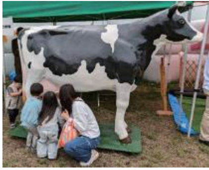
乳しぼり体験の様子

②子牛の展示 ③酪農情報コーナー ④ロールベール看板展示・ロールベールキャンバス お絵描き ⑤堆肥の販売 ⑥畜産物販売等の出店(チーズケーキの販売、鶏卵・玉子を使った料理の販売、蜂蜜の販売、卵ジャンケンゲーム、牛乳パック工作等) ⑦牛乳無償配布(数に限りがあります) ※開催内容は、変更する可能性があります。