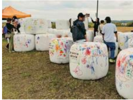
ロールベールキャンパスお絵描き

②子牛の展示 ③酪農情報コーナー ④ロールベール看板展示・ロールベールキャンバス お絵描き ⑤堆肥の販売 ⑥畜産物販売等の出店(チーズケーキの販売、鶏卵・玉子を使った料理の販売、蜂蜜の販売、卵ジャンケンゲーム、牛乳パック工作等) ⑦牛乳無償配布(数に限りがあります) ※開催内容は、変更する可能性があります。