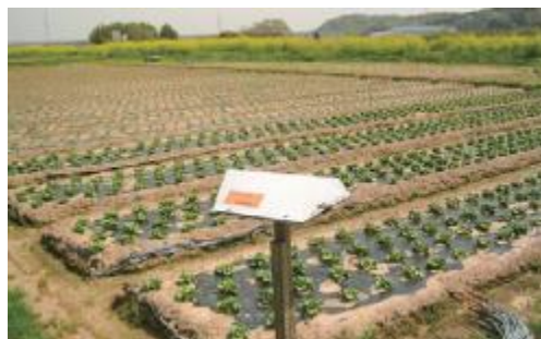
木更津市に設置したフェロモントラップ

農業事務所では、今後もレタスの安定生産に資する取組を実施していくとともに研修会等を通じて生産者の皆様に様々な情報提供を行い、レタス産地を支援していきます。（鈴木）