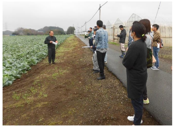
写真1 先進経営体を視察

資金の返済は、所得から行われるため、生活費を含め必要な所得を確保する必要がある。そこで、青年等就農資金の借入者毎に担当普及職員を配置し、個別指導を実施している。また、農業次世代人材投資資金の受給者に対しては市との連携で、就農状況の確認を行い、併せて補助事業や制度融資の効果的な活用推進を行っている。