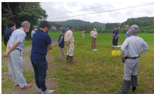
説明を聞く参加者

今後は、収量コンバインや施肥田植機の実演も予定しており、スマート農業技術を活用した水稻の安定生産について、普及を進めていきます。