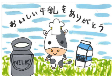
H26 おいしい牛乳ありがとう 絵手紙コンクール作品

千葉市と八千代市では都市近郊及び台地畑作地帯で、また、市原市では台地畑作地帯と水田地帯及び南部中山間地帯で酪農、肉牛、養豚、養鶏がそれぞれ営まれています。