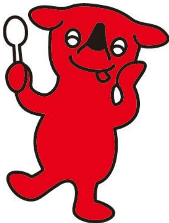
千葉県マスコットキャラクター チーバくん

保育所や幼稚園での食育活動を支援するため「ちば食育サポート企業」が実施している食育体験プログラムをぜひご利用ください。 プログラムについては、直接、各企業等へお申し込みください。