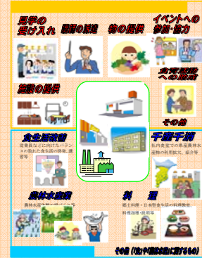
ちば食育サポート企業