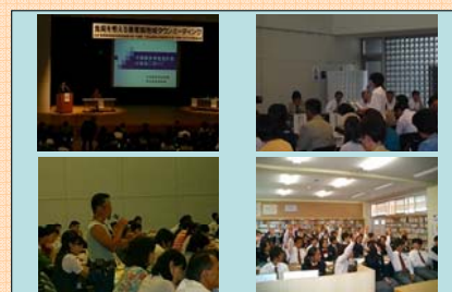
地域タウンミーティングの様子