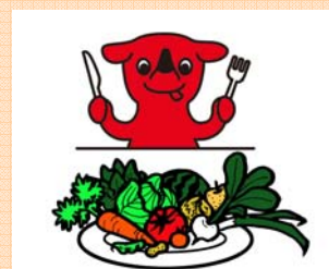
広げよう！ちばの食育