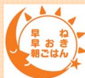
早ね早おき朝ごはんシンボルマーク