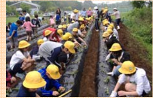
「ちばっ子元気に」食と農の体験事業の実施風景