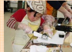
親子の郷土料理教室