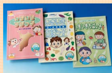
食育学習ノート「いきいきちばっ子」