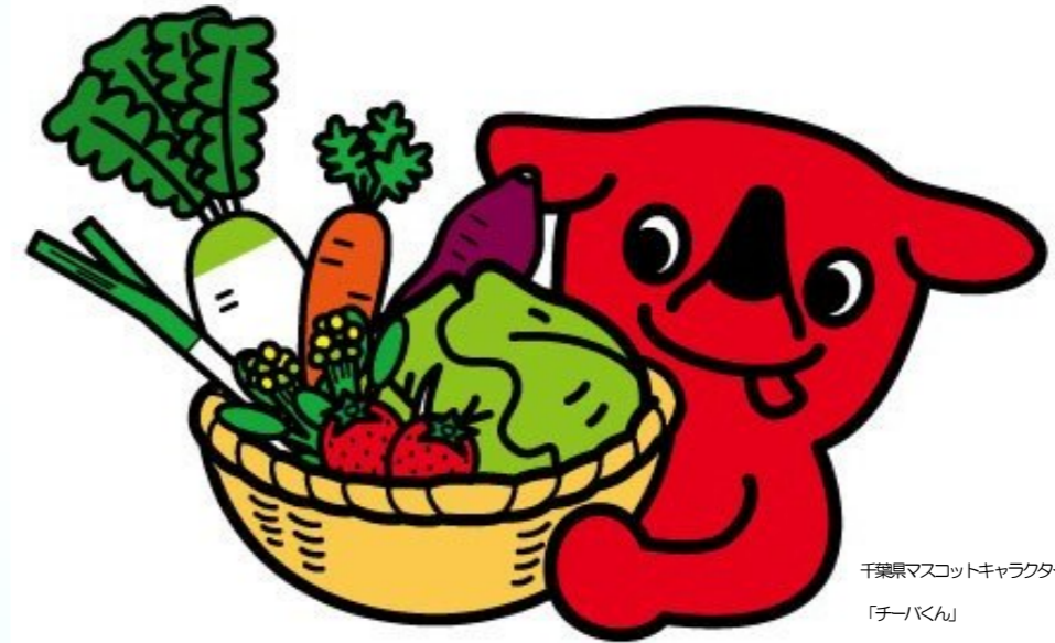
千葉県マスコットキャラクター「チーバくん」

「ちばの恵み」を取り入れたバランスのよい食生活の実践による生涯健康で心豊かな人づくり