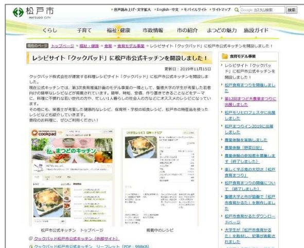
(松戸市ホームページ)