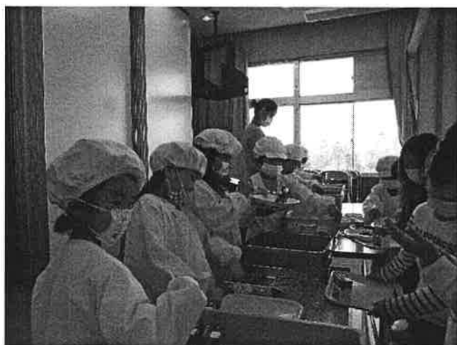
給食の配膳の様子