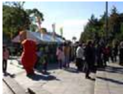
・ちばエコ農産物試食展示