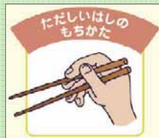
イラスト 食に関する学習ノート「いきいき ちばっ子」1・2年生用より

口腔機能 (こうくうきのう) :摂食(食べ物を捕らえる)、咀嚼(食べ物をかみ砕く)、嚥下(食べ物をのみ込む)機能と発音機能など口からのどまでの部分が行う機能をさします。