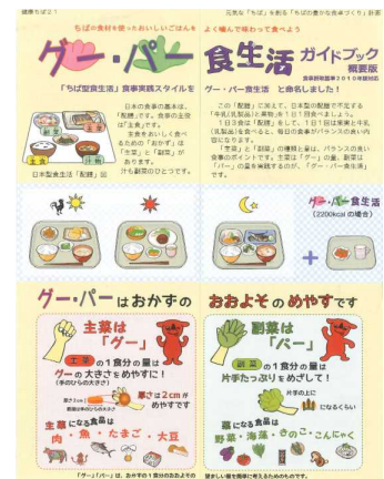
「グー・パー食生活ガイドブック (ちば型食生活食事実践ガイドブック)」