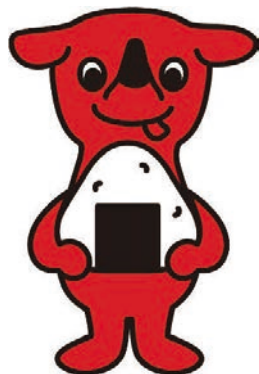
千葉県マスコットキャラクター チーパくん