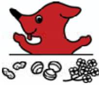
豊富な食材や食文化