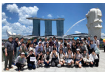
シンガポールでの海外研修

東葛飾中学校は「生徒主体」を重視しており、学校の行事運営や広報活動は主に生徒が行っています。ホームページでは生徒が作成した学校の紹介動画や日誌が公開されており、生徒目線で学校の様子を知ることができます。他にも、地域や日本の伝統文化のフィールドワークや海外研修など多角的な視点で現代社会を捉える学びの場が多くあります。また、企業との探究プログラムにも多数参加し、昨年度の成果を発表する全国大会では高校生も参加する中、優秀な成績を収めました。